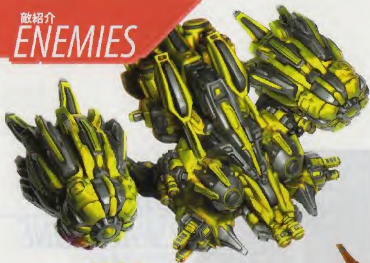
シティガード CITY GUARD